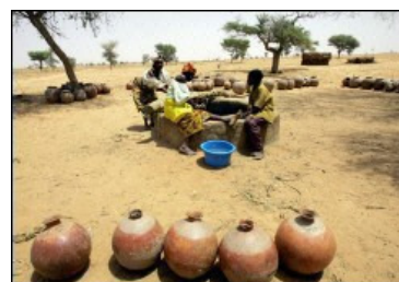
Zona desértica del Niger.

Así se expresaba el ministro argelino, en una Conferencia contra la desertificación, acentuando que 100 millones de personas se arriesgan a perder sus tierras, poblados y oasis en los años que seguirán, y “aparecerán nuevos conflictos alrededor de los recursos naturales” lo que creará los nuevos “refugiados del medio ambiente”